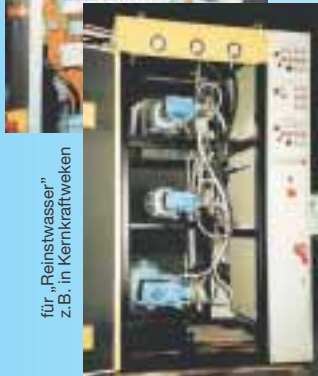
für „Reinstwasser“ z.B. in Kernkraftwerken